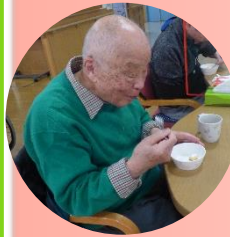
おやつはケーキを頂きました