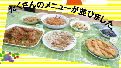
たくさんメニューが並びました