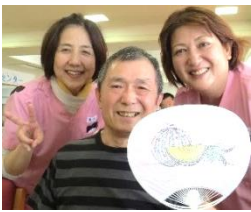
愛する妻に作り ました♪