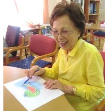
塗り絵なんて 久しぶり！