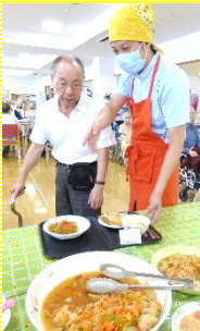
どれにしようか悩み中。