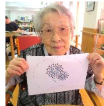
満足の出来栄え だよ♪