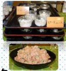
長テーブルに並んだ料理の数々