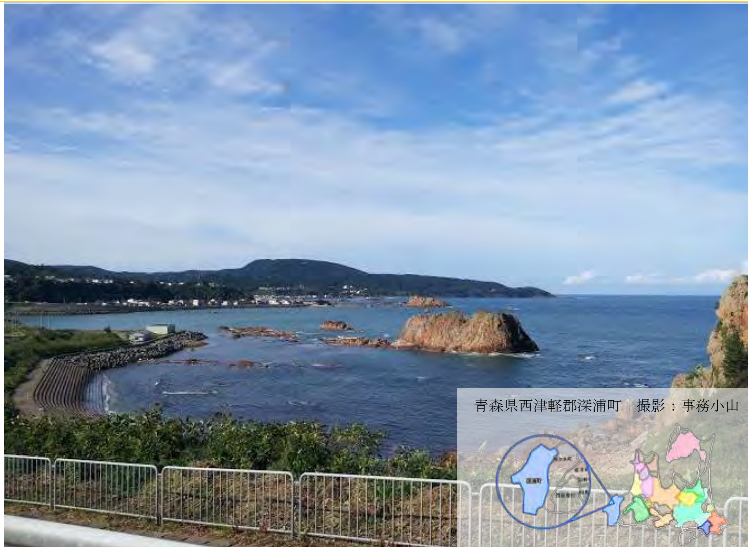
青森県西津軽郡深浦町