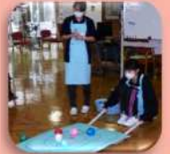
どじょうすくいで大爆笑 どこからともなく武士参上