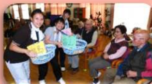
都道府県クイズ！大正解～