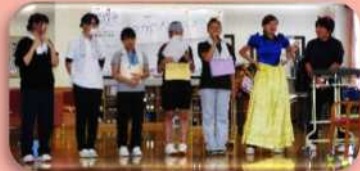
レクリエーションの説明中

聖マリアンナ医科大学看護専門学校の学生さん10名の施設実習が行われました。送迎時やフロア内で利用者様と触れ合い、実習の最終日には、学生さん企画のレクリエーションで盛り上がる事ができ、貴重な体験ができました、とのことでした。皆様、ご協力ありがとうございました。